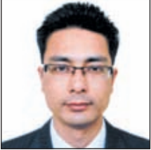
नेपाल भूषण श्रेष्ठ प्रमुख-कर्जा कर्पोरेट